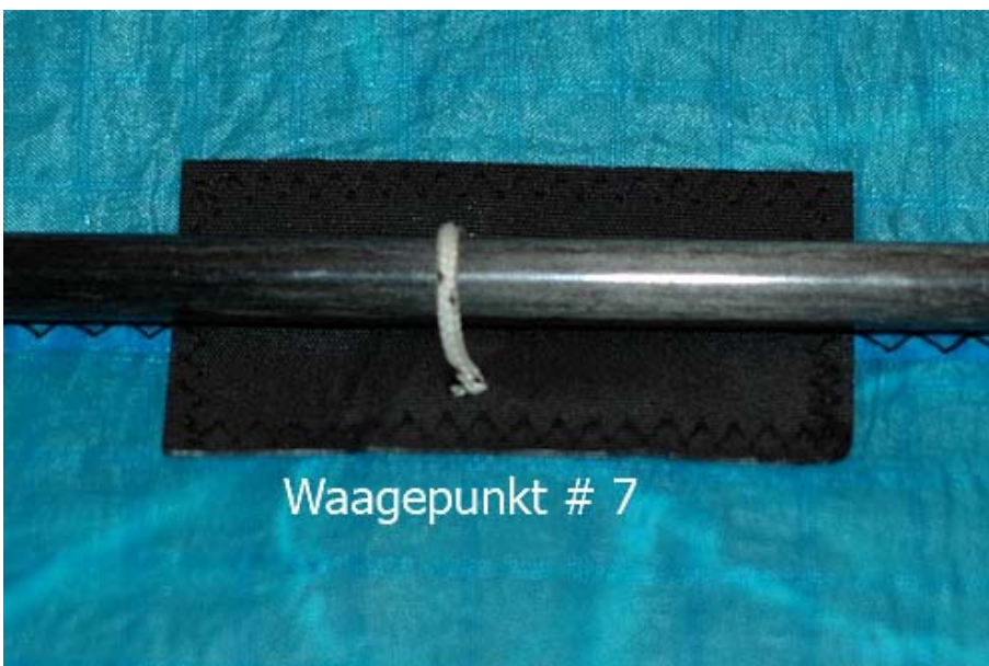
Waagepunkt # 7