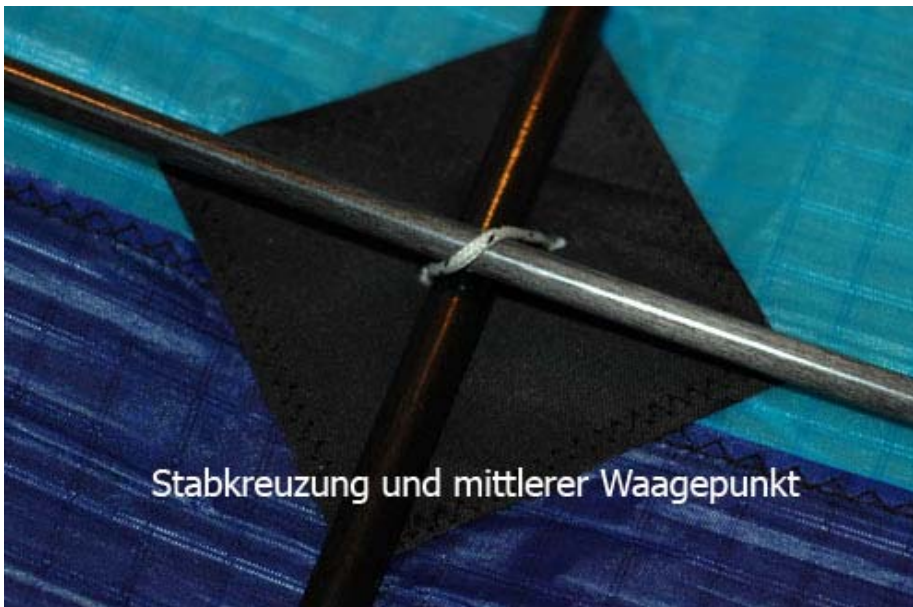
Stabkreuzung und mittlerer Waagepunkt