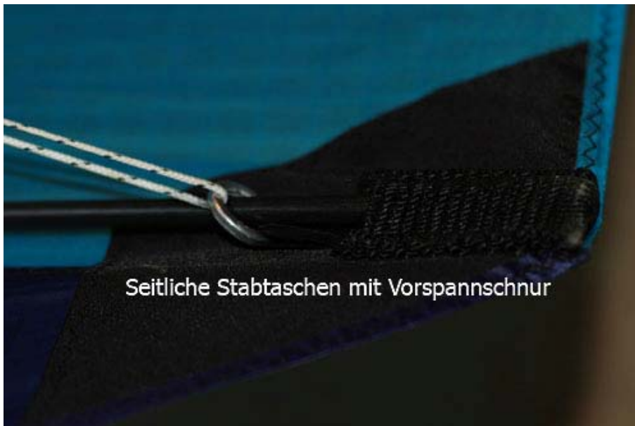
Seitliche Stabtaschen mit Vorspannschnur