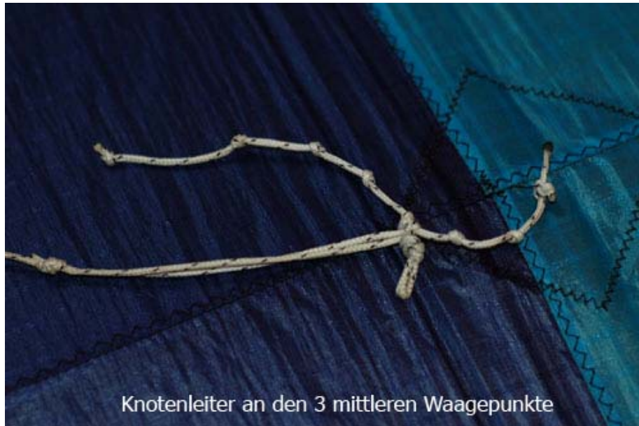
Knotenleiter an den 3 mittleren Waagepunkte